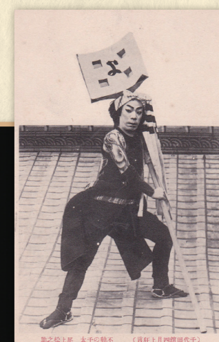
不動の千太 (尾上松之助) 雷門大火・血染の纏