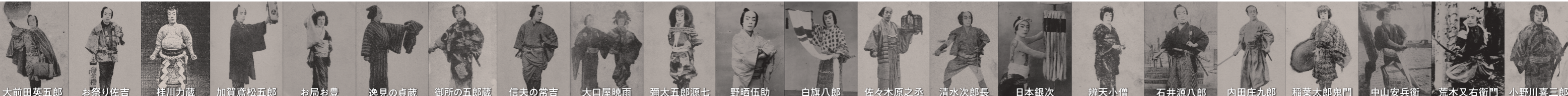
大前田英五郎 お祭り佐吉 桂川力蔵 加賀斎松五郎 お局お豊 逸見の貞蔵 御所の五郎蔵 信夫の常吉 大口屋暁雨 彌太五郎源七 野晒伍助 白旗八郎 佐々木原之丞 清水次郎長 日本銀次 辨天小僧 石井源八郎 内田庄九郎 稲葉太郎鬼門 中山安兵衛 荒木又右衛門 小野川喜三郎